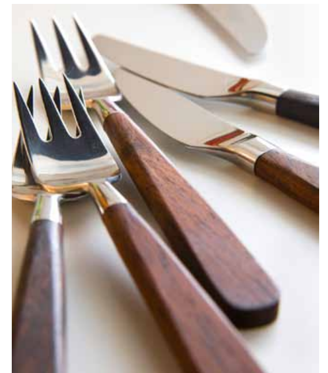
Bertel Gardbergin muotoilemat kauniit Hackmanin aterimet rouva on saanut äidiltään.

– Miksi laittaa asuntoon pientä saunaa, kun taloyhtiön katolla on upea saunaosasto? Sen voi varata käyttöönsä milloin tahansa ja viikonloppuna vaikka koko päiväksi.