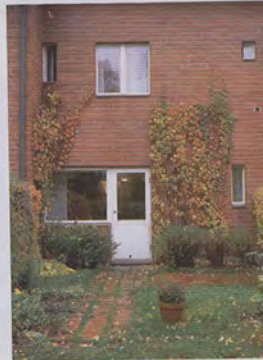
Tiilitalo odottaa pihasuunnitelmaa, jota alpeaan toteuttaa seuraavaksi.

Kaikki asunnon pintamateriaalit uusittiin alakerran hyvin säilynyttä tammiparketia lukuun ottamatta. Suurimpia muutoksia oli yläkertaan vievien portaiden uusiminen. Talon alkuperäisen hengen mukainen lakattu mäntyportaikko sai mennä.