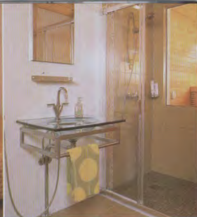
Kauniit vedenvihreät sävyt luovat rauhallisen tunnelman kylpyhuoneeseen. Laatat ovat Home 4 Youn mallistosta.

Olohuoneen muihin seinäin tuli Borås Effekt -sarjan vaaleakuvioinen tapetti, jonka elävä pintastruktuuri vaihtelee valaistuksen mukaan. Yläkertaan vievä portaikko näkyy myös olohuoneen puolelle, ja korkeaan seinään haluttiin jotakin näyttävää. Lauritzonin Cole & Son -mallistosta löytyi ornamanttikuviainen tapetti, jossa on kaunis vaaleanliila sävy.