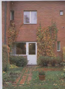
Tiilitalo odottaa pihasuunnitelmaa, jota aletaan toteuttaa seuraavaksi.

Kaikki asunnon pintamateriaalit uusittiin alakerran hyvin säilynyttä tammiparkettia lukuun ottamatta. Suurimpia muutoksia oli yläkertaan vievien portaiden uusiminen. Talon alkuperäisen hengen mukainen lakattu mäntyportaikko sai mennä.