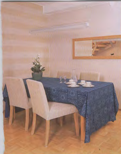
Finlaysonin värikäs Shanghai-pöytälinja piristää olohuoneen ruokailuryhmää. Arabian Pallas-kahvikupit ovat kauniit ja ajattomat. Sandbergin raitatappeti on asennettu poikkeuksellisesti vaakana.