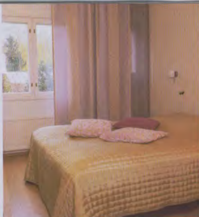
Lauritzonin koristetyyny toistavat makuuhuoneen herkkäillä pastellisävyytä.