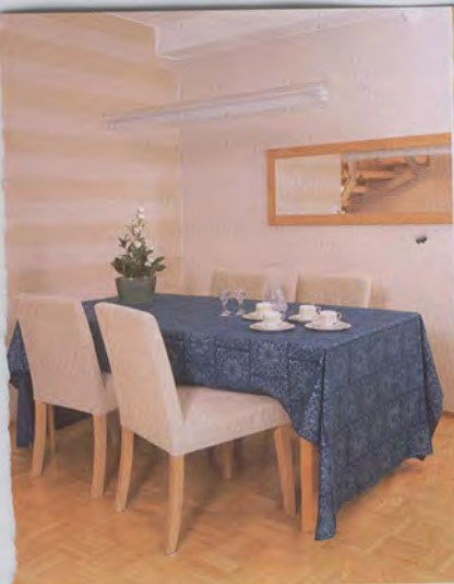
Finlaysonin väriä Shanghai-pöytällä piristää olohuoneen ruokailuryhmää. Arabian Pallas-kahvikupit ovat kauniit ja ajattomat. Sandbergin raitatappeti on asennettu poikkeuksellisesti vaakana.